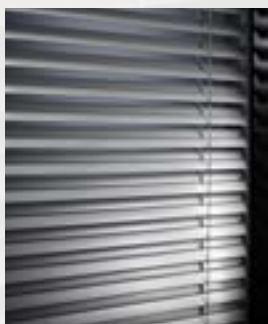
Ottimizzazione della luce naturale.

Quando si abbassano, le lamelle restano inizialmente aperte – si chiudono completamente solo all'ultimo momento. In questo modo l'ambiente resta illuminato naturalmente fino alla chiusura.