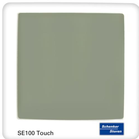
Abbildung 1: Steuerzentrale SE 100 Touch