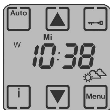
Abbildung 2: Display-Anzeige SE 100 Touch